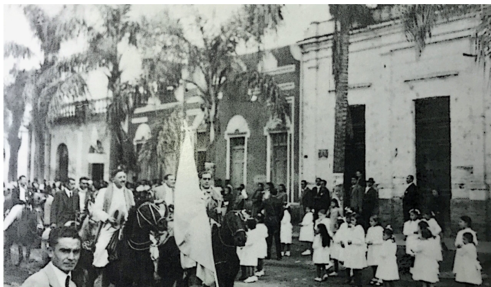
Desfile conmemorativo de la independencia argentina realizado en Bella Vista el 9 de julio de 1946. La imagen permite apreciar un sector de la villa cívica (de fondo).

En el terreno político, el peronismo reformuló las lealtades locales al cuestionar la urdimbre tejida por la patronal y dar cauce a formas renovadas de representación a través de las sucesivas organizaciones partidarias creadas desde finales de 1945. El repliegue público del propietario del ingenio y su alejamiento de las filas radicales fue sintomático de un nuevo clima de época, en el que las prácticas políticas locales ganaron en autonomía frente a la patronal. Su expresión más nítida fueron los resultados electorales, terreno en el que el peronismo arrasó, confinando al radicalismo a un lugar marginal. Bajo el amplio paraguas del peronismo, convergieron los liderazgos sindicales con figuras emanadas del funcionariado cívico y el influyente sector comercial local. Aunque el notable peso cuantitativo y simbólico otorgaba a las dirigencias obreras credenciales suficientes para reclamar la conducción del emergente movimiento político, a tono con una tendencia cara al gremialismo azucarero tucumano, esta pretensión no fue avallada por las autoridades provinciales y nacionales del peronismo, que encapsularon la influencia sindical (Rubinstein,