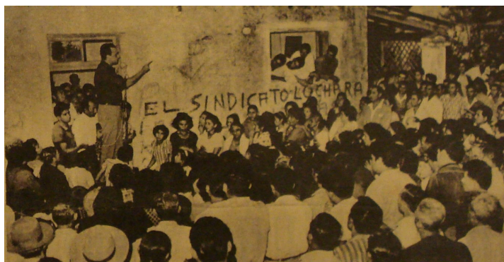
Asamblea en el sindicato del ingenio Santa Ana durante la ocupación de la fábrica, febrero de 1964.

mada en 1.500 personas, se movilizó en 15 camiones, 4 ómnibus y otros vehículos que recorrieron las zonas céntricas de las ciudades del interior antes de llegar a la capital. 100 El problema de Santa Ana alcanzó una amplia repercusión en la prensa, pero en la Legislatura se adujo el “clima de agitación” para suspender la sesión. La prórroga fue aprovechada por los parceleros, obreros y empleados de ISASA para presentar un memorial al presidente Illia y para ocupar la fábrica exigiendo la continuidad de la empresa. Finalmente, en sesión extraordinaria los diputados discutieron el proyecto de ley y ratificaron por mayoría los decretos de la intervención.