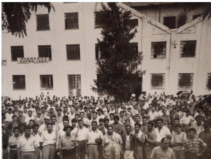
Protesta obrera en reclamo de financiamiento para la zafra de 1965.

las 117.085 bolsas, habiendo vendido solamente 7.042. 111 En tal situación, el crédito que posibilitó iniciar las labores en 1965 fue otorgado por el gobernador. Se trataba de 45 millones derivados de las partidas nacionales obtenidas para ingenios oficiales. 112