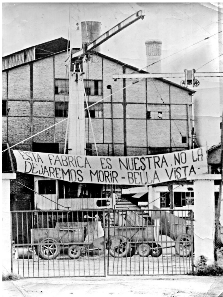
Ocupación del ingenio Bella Vista en el marco de las resistencias locales al cierre de la fábrica (enero de 1969).

La historiografía azucarera ha contemplado la dimensión territorial para estudiar los cambios espaciales y sociales en su paisaje productivo. Los nuevos circuitos ferro-